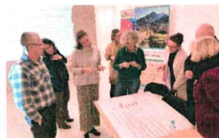
Atelier à Péri