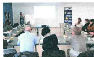
Atelier à Bastelicaccia